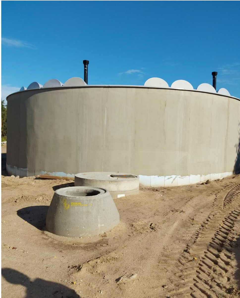
Zbiornik osadu nadmiernego