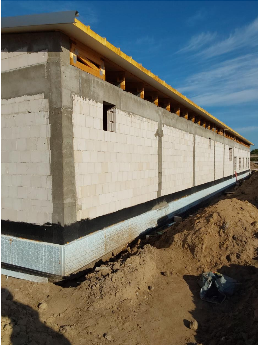
Dalsze prace izolacyjne przy budynku technicznym