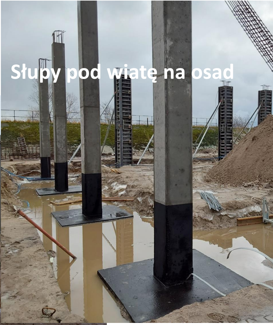
Słupy pod wiatę na osad