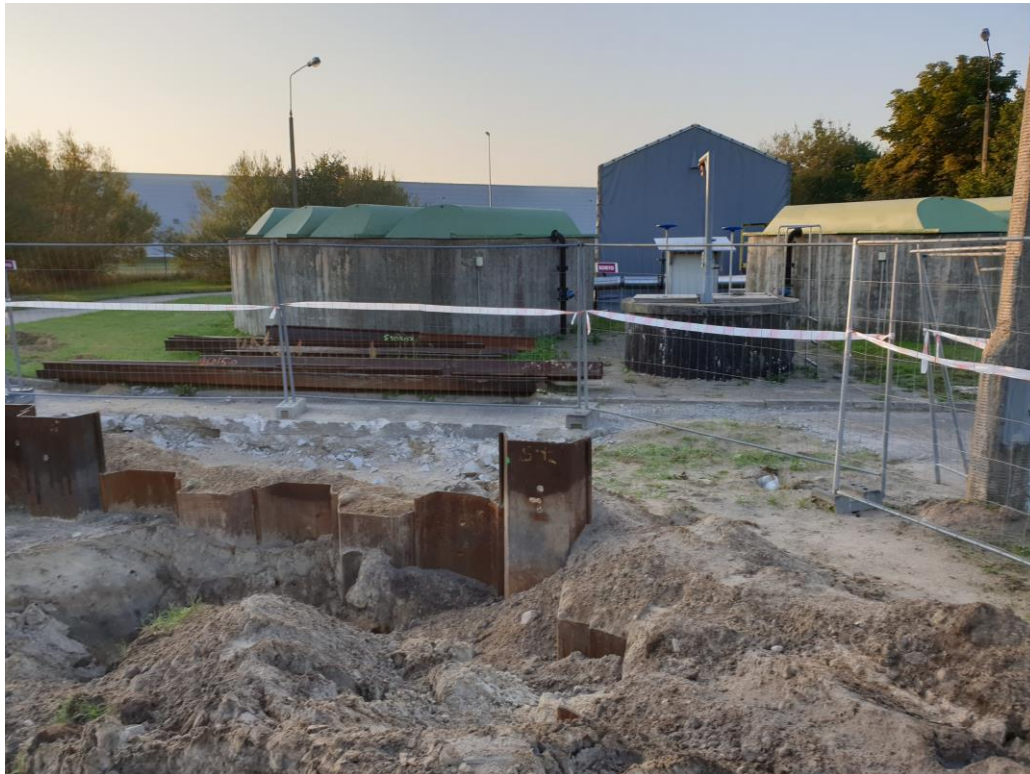
Zbiornik ścieków dowożonych