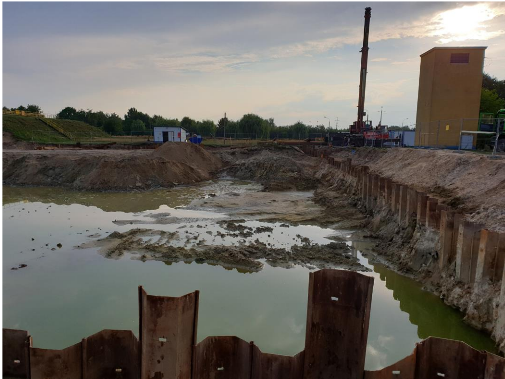
Odwodnienie przyszłych reaktorów