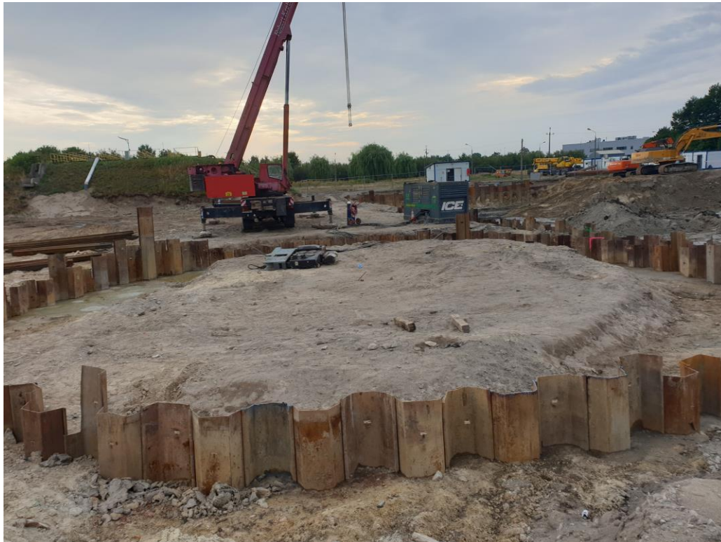
Przygotowanie odwodnienia terenu pod budowę reaktorów