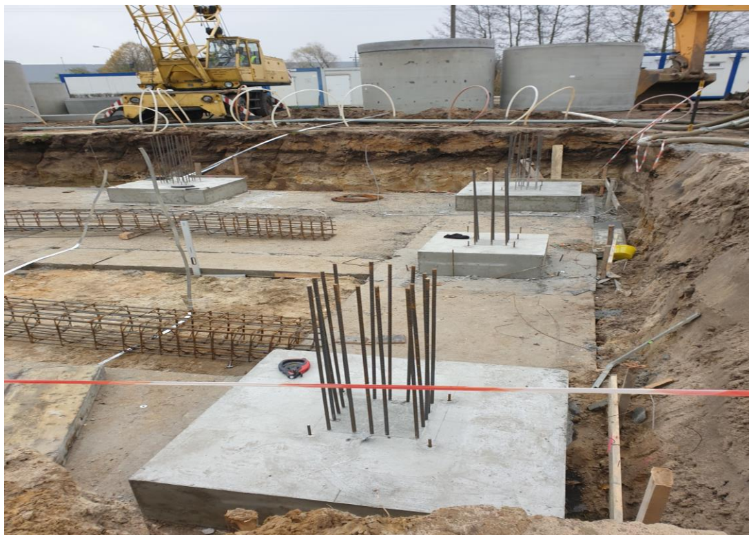
Słupy pod konstrukcję wiaty na osad