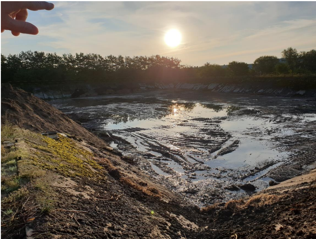
Porządkowanie terenu po lagunach