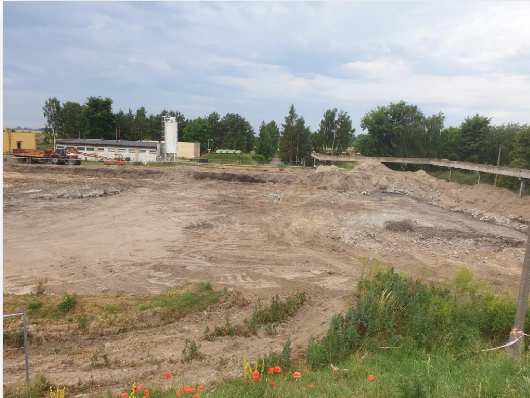
Teren przygotowywany do robót