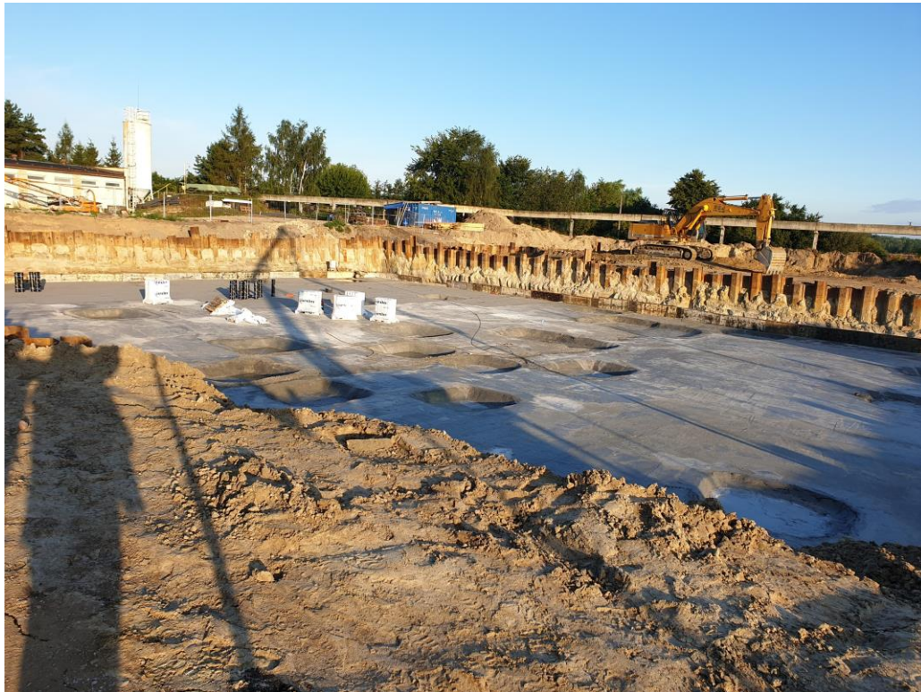
Komora reakcji ciąg dalszy prac