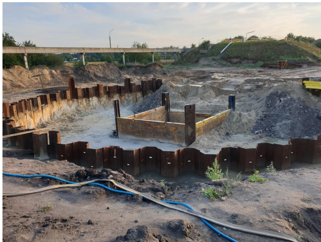
Prace budowlane przy pierwszym osadniku wtórnym