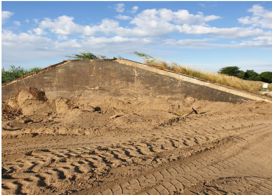
Roboty ziemne w pełni